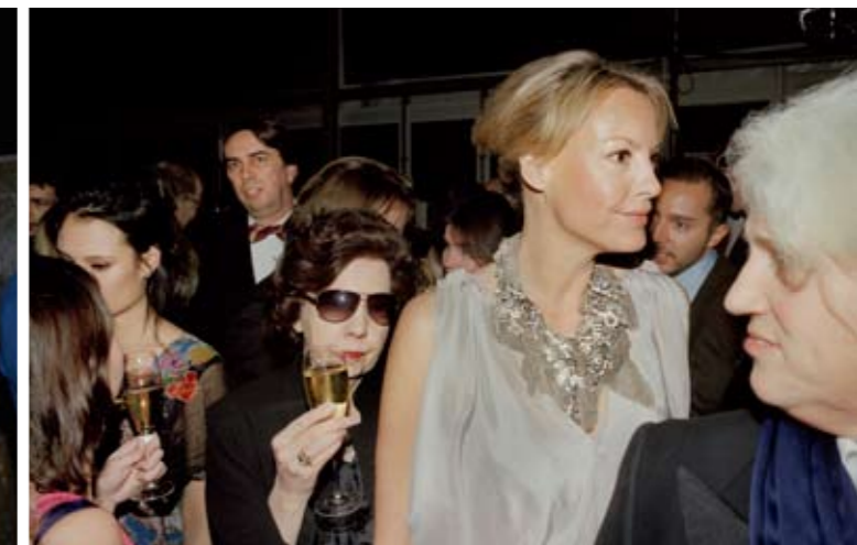
Dringen op het terrein van de Westergasfabriek