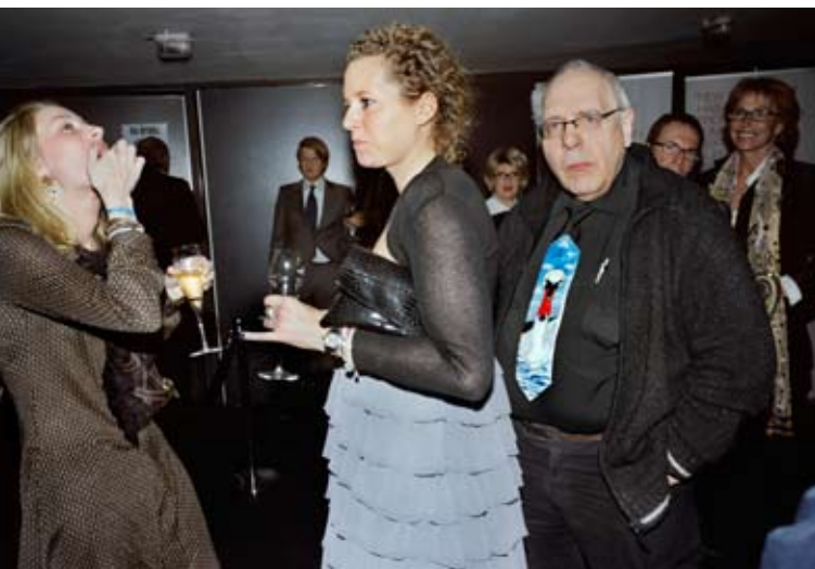
Fashion-statements bij de opening van de Fashion Week