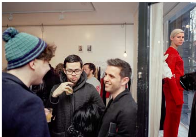
Harig accessoire onder de arm bij kledingwinkel Individuals

► gen. Molenaar houdt zich afzijdig. Als een stervende kat die achter een boom is gaan liggen om in stilte de laatste adem uit te blazen.